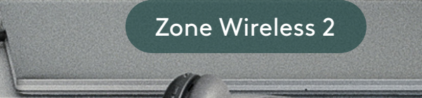
Zone Wireless 2