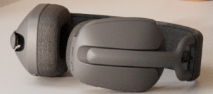
Zone Vibe Wireless