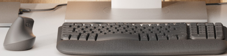
Wave Keys for Business