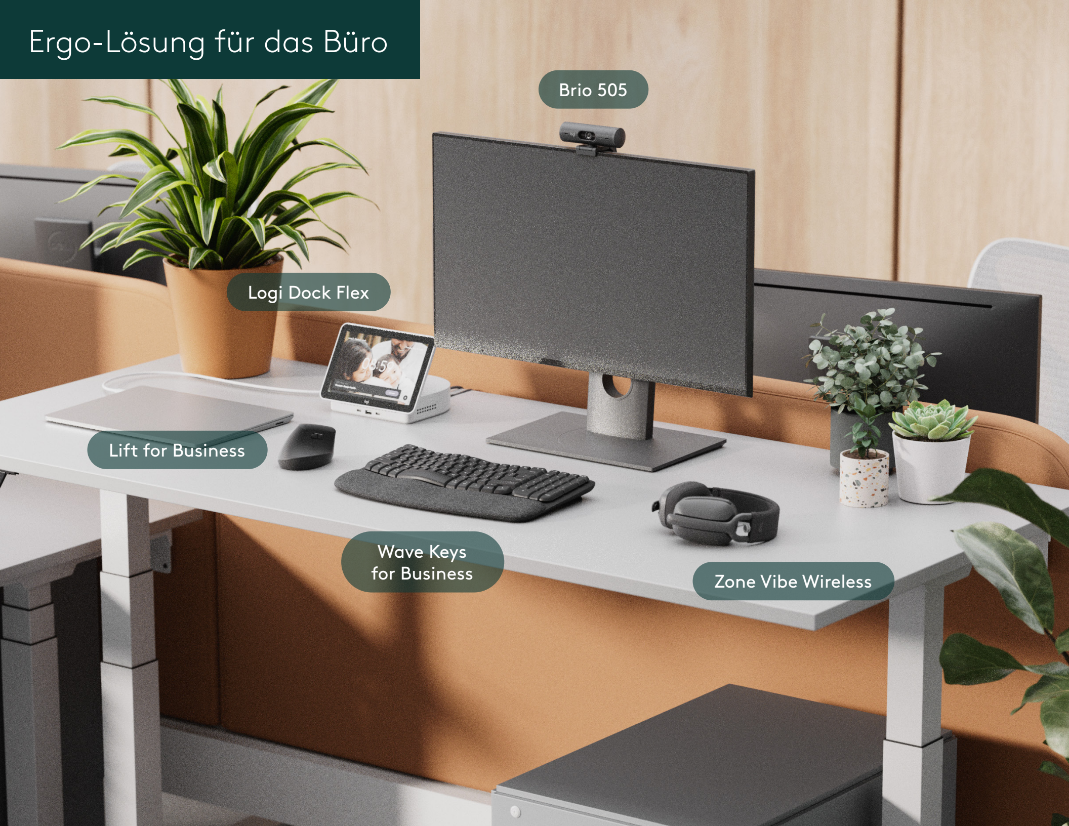
Zone Vibe Wireless