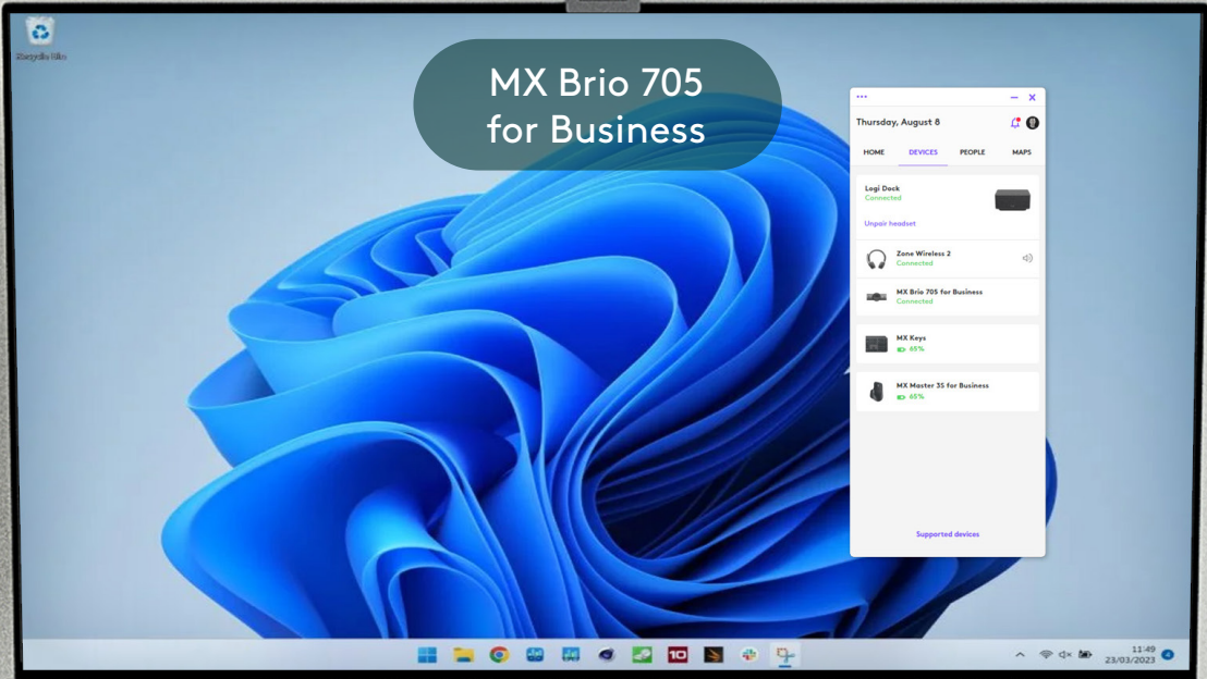
MX Brio 705 for Business