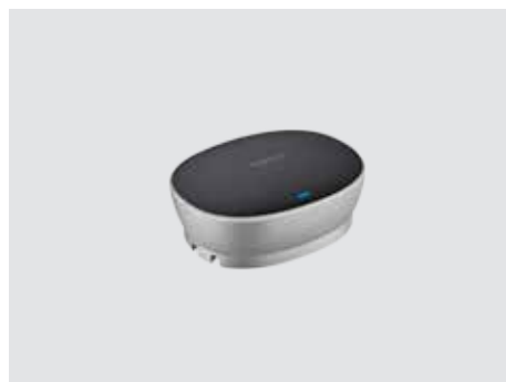
ΣΥΝΔΕΣΙΜΟΤΗΤΑ ΚΑΙ ΧΡΗΣΗ

Επεκτείνετε το πεδίο της συζήτησης από 6 m/20 πόδια σε 8,5 m/28 πόδια, ώστε να ακούγονται καθαρά ακόμη και όσοι βρίσκονται μακριά από το ηχείο ανοιχτής συνομιλίας. Τα μικρόφωνα διατίθενται σε ζεύγη και αναγνωρίζονται και ρυθμίζονται αυτόματα μόλις συνδεθούν στο ηχείο ανοιχτής συνομιλίας.