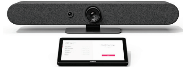
Figura 5: Logitech Rally Bar Mini e un dispositivo di controllo Tap

Rally Bar Mini è una barra video Android che include una videocamera 4K, un array di microfoni beamforming da sei elementi e due altoparlanti progettati per l'uso in sale riunioni di piccole e medie dimensioni. Rally Bar Mini supporta inoltre fino a due microfoni di espansione.