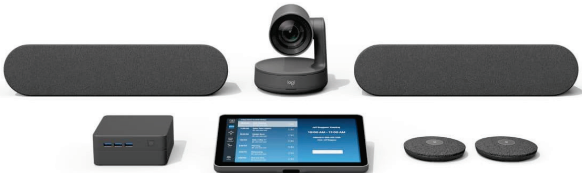
Figura 4: Logitech Rally Plus in un kit Zoom Rooms che include un dispositivo di controllo Logitech Tap

Rally Plus è un sistema per videoconferenze modulare che include una videocamera 4K con panoramica, inclinazione e zoom motorizzati, due altoparlanti e due mic pod. Rally Plus può supportare fino a sette mic pod.