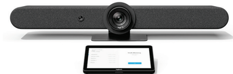
Figura 6: Logitech Rally Bar e un dispositivo di controllo Tap

Rally Bar è una barra video Android che include una videocamera 4k, un array di microfoni beamforming da sei elementi e due altoparlanti progettati per l'uso in sale riunioni di medie e grandi dimensioni. Rally Bar supporta inoltre fino a tre microfoni di espansione e offre la funzione di amplificazione acustica per adattarsi alle sale più grandi.