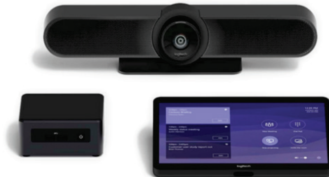
Figura 3: Logitech MeetUp in un kit Microsoft Teams Rooms Windows che include un dispositivo di controllo Logitech Tap

MeetUp è una barra video USB che include una videocamera 4K, un array di microfoni beamforming da tre elementi e un altoparlante personalizzabile progettato per l'uso in sale riunioni di piccole dimensioni.