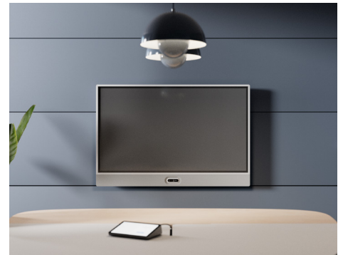
墙面安装配件下方装有摄像头

Rally Board 65 设计灵活, 可满足您的会议方式。它在 Android、PC 或 BYOD 模式下与 Microsoft Teams、Zoom 和 Google Meet* 等主流平台无缝协作, 因此您可以轻松调整 Rally Board 65 以满足当前和未来的需求。此外, 它还提供多种安装选项**, 因此您可以将其安装到任何开放空间或会议室。摄像头专为部署于屏幕上方或下方而设计, 让各种空间中的参会者都能保持自然的眼神交流。